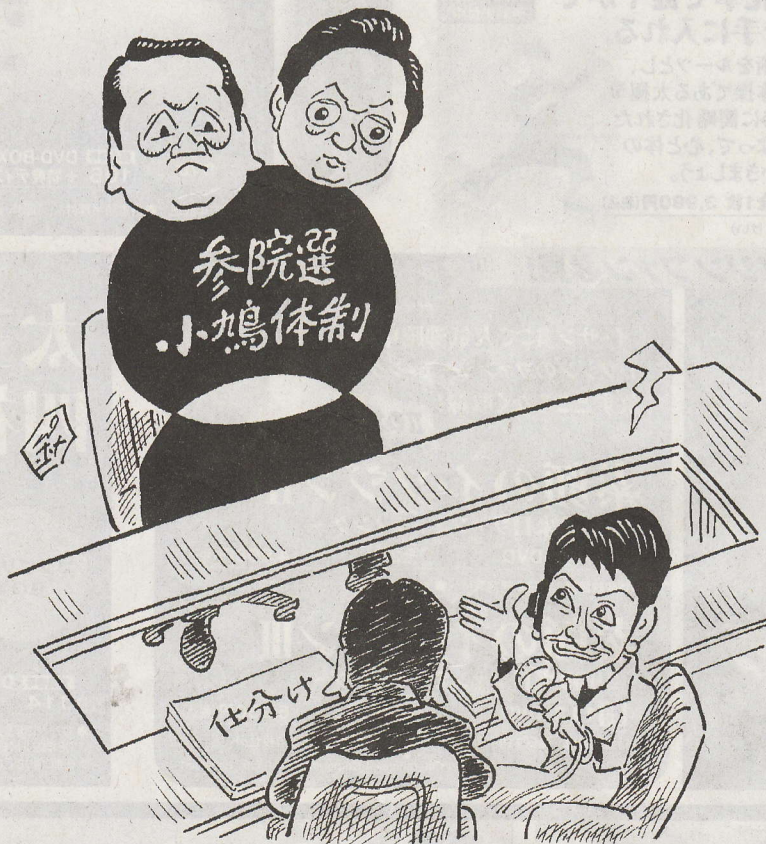
これも なんとか出来ないかしら