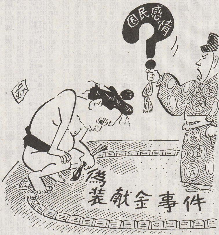
物言いつき勝ち名乗り